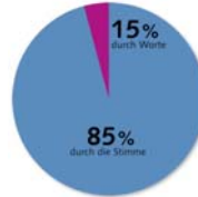
Gesprächssituation „ear to ear“

Mit stimmotion ® nutzen Sie 85% Ihrer Kommunikationskompetenz effektiv, indem Sie